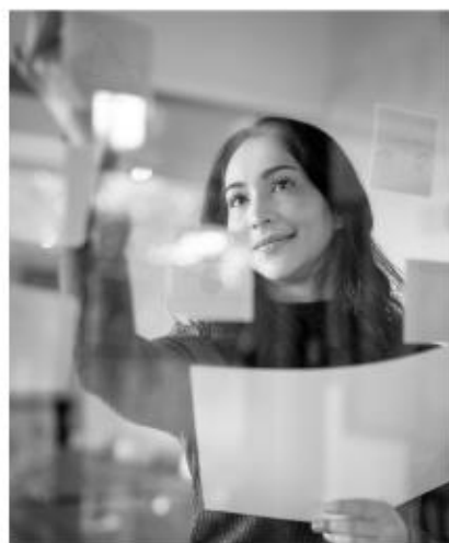
WSPÓŁPRACA Z OTOCZENIEM BLIŻSZYM I DALSZYM