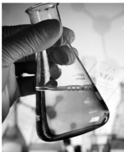
POPULARYZACJA NAUKI I KSZTAŁCENIA