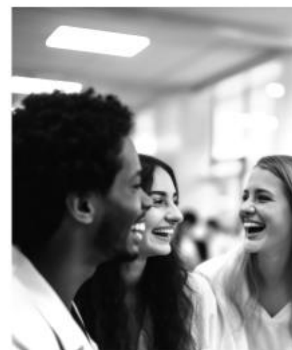
UMIĘDZYNARODOWIENIE NAUKI I KSZTAŁCENIA