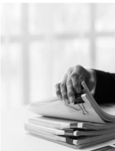
TRANSPARENTNE I ZROZUMIAŁE FINANSE