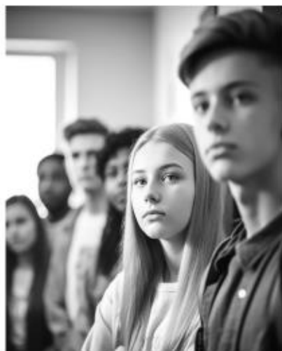
KSZTAŁCENIE POKOLEŃ ZET I ALFA